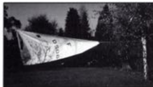
Sejlet er hængt til tørring.

Til kattens udelte tilfredshed i et rum, de har adgang til! Tak for i år! Vi ses igen næste år.