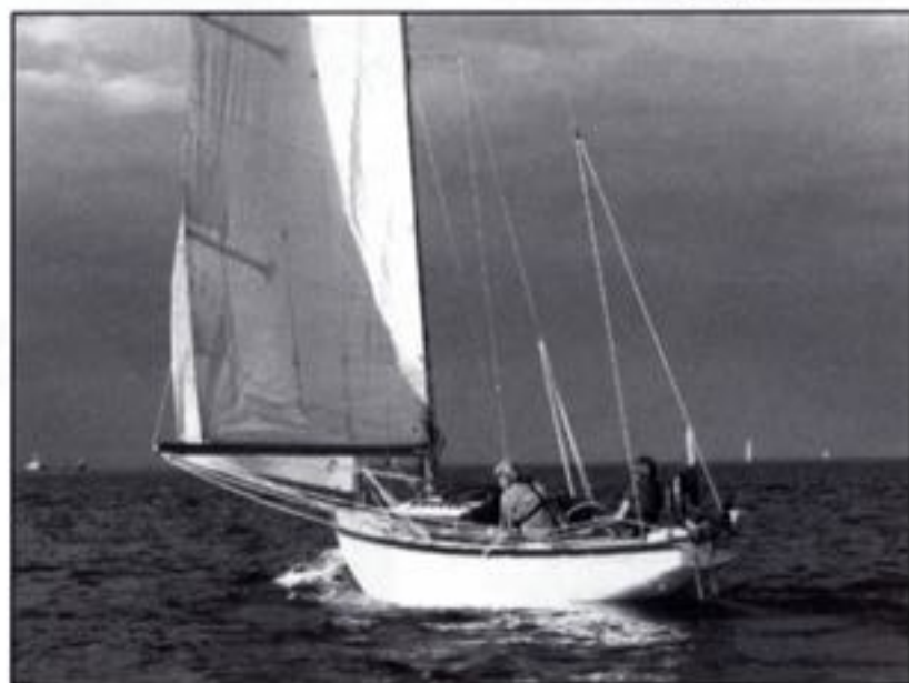
A 46 Saxon med skipper Simon og gæst Eva.

Bag arrangementet står Københavnske Træsejlere, der er DFÆL's lokalgruppe i det kø-