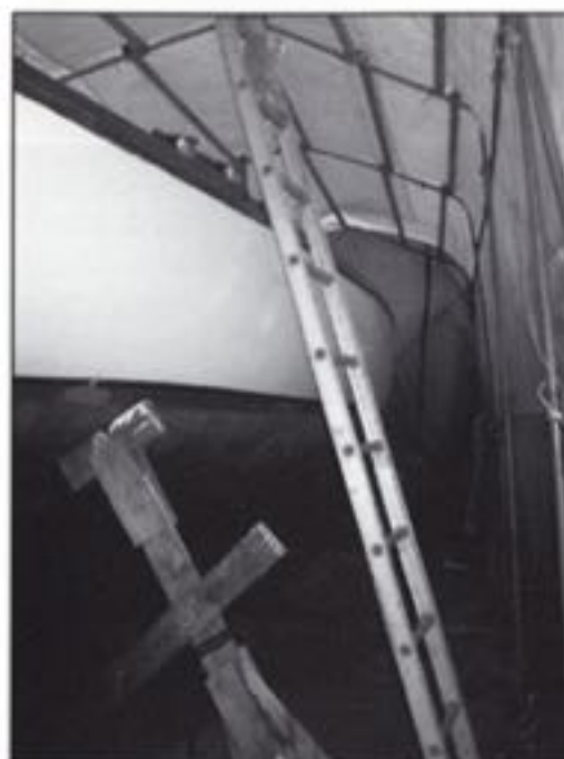
Så er båden på land og bådteltet er rejst. Parat til vinterens arbejde men også til at byde velkommen til DFÆL's medlemmer, når der er Åben Båd.

Abildvej 5E, 5700 Svendborg. (Ved havnen i Svendborg køres mod Thurø. Abildvej ligger til venstre efter de gamle Kelloggsbygninger). Ved hoveddøren hænges skilte op, som viser vej.