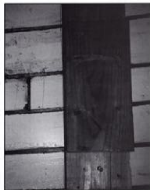
Stødene, de lodrette samlinger mellem bordene, er også nådlimet. Det lodrette bræt sikrer at fræseren kan styre rigtigt til den lodrette fræsning.

Du kan læse mere om Joane på bådens hjemmeside: www.joane.dk