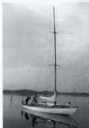
Hiawatha i vindstille