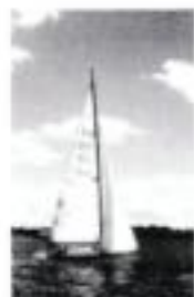
Forsidefoto: 38 kvm ved kapsejladsen i Nyborg