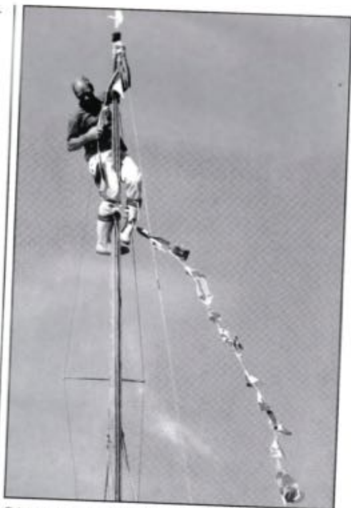
Ø-havets stævne '97

komme indenfor. Nogle havde lavet mad i bådene, andre i forsamlingshusets fine køkken. Det blev en hyggelig aften. Gunnar fortalte en lang række morsomme historier fra sin hjemegn og Jørgen, der havde forberedt en