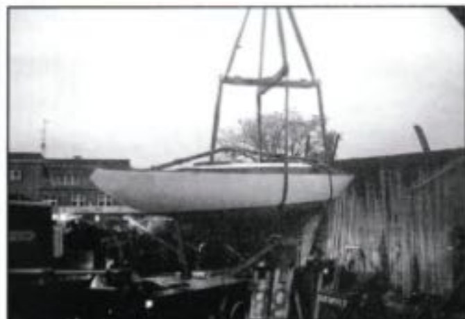
"Oui-Oui" hejses på plads i KAS

Usædvanligt klub-initiativ skal redde 6-meteren Oui Oui