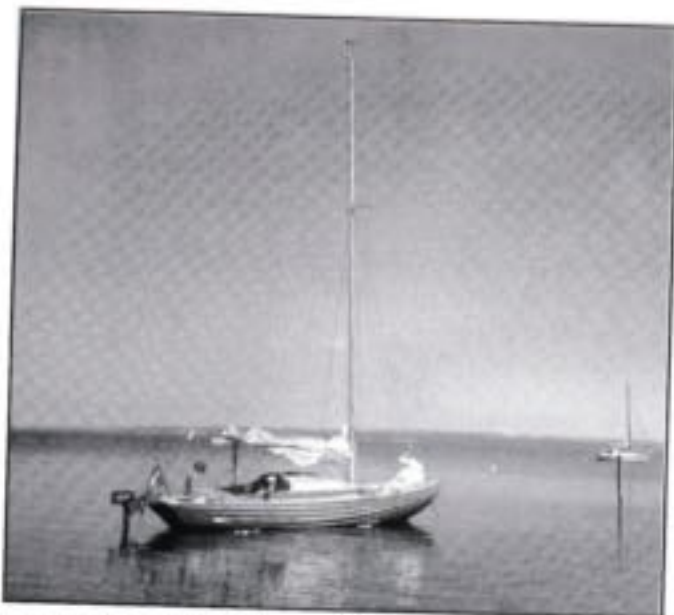
"Lykken er...."

Fejå, mens der stadigvæk var lidt mere end luft nok, så hun blev ganske betydeligt gennemvædet af Staalbybet og Storebælt, men godt vil med til