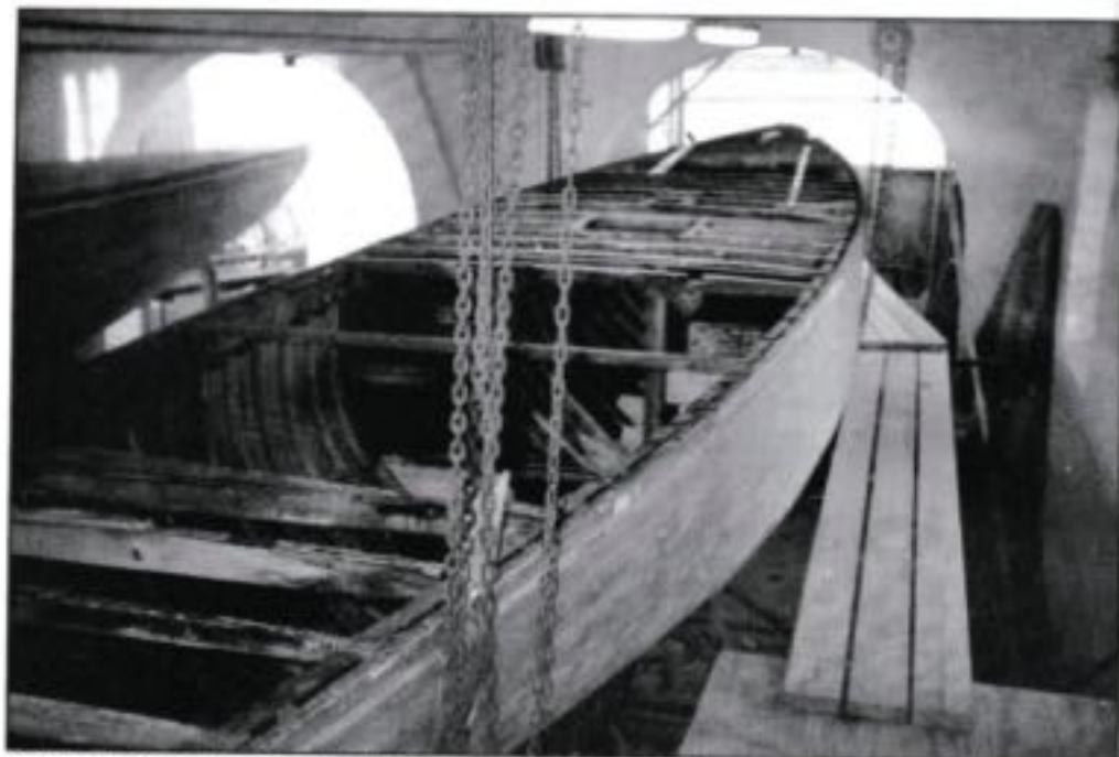
Baronens 6-meter

Johan Anker. Båden er købt i USA 1989 af en dansk bådebygger, der boede der i en årrække. I 1992 flyttede han tilbage til Danmark, og tog båden med. Den har den har sevfølgelig derfor ikke været registreret i Danmark før og bør tildeles sejlnummer 6 D 63.