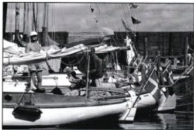
Ø-havets stævne '97