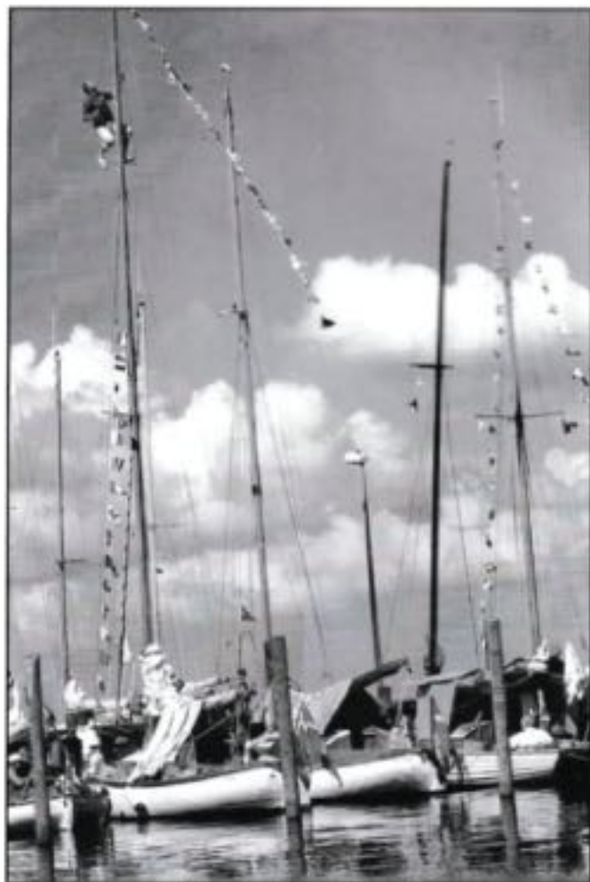
Ø-havets stævne '97

Næste dag blev der ryddet op i forsamlingshuset. Vinden var jævn fra S, så det tegnede godt for hjemturen. Vi fulgtes med bådene fra Faldsled, der dog havde tid til en frokost på Lyø. Cap Horne og - Helnæs viste