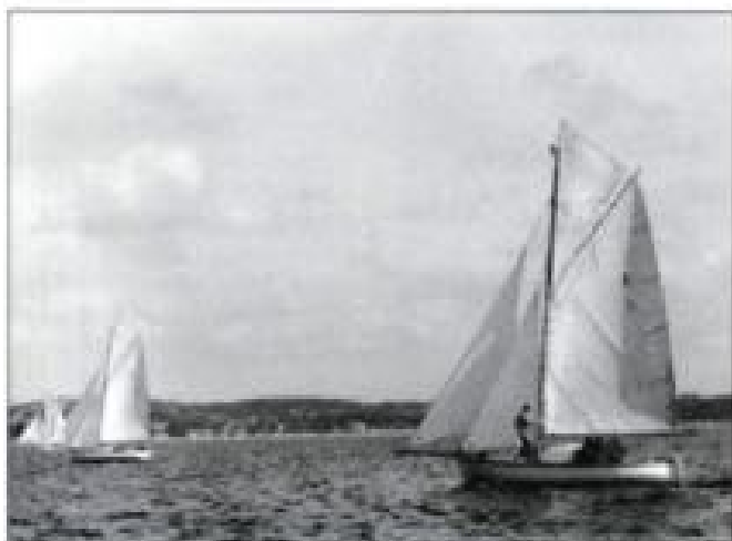
Gaffelriggede skolebåde på sommeretur.