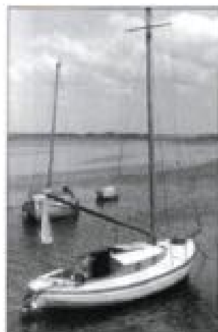
Selma ved Kongsgaards bro 1957