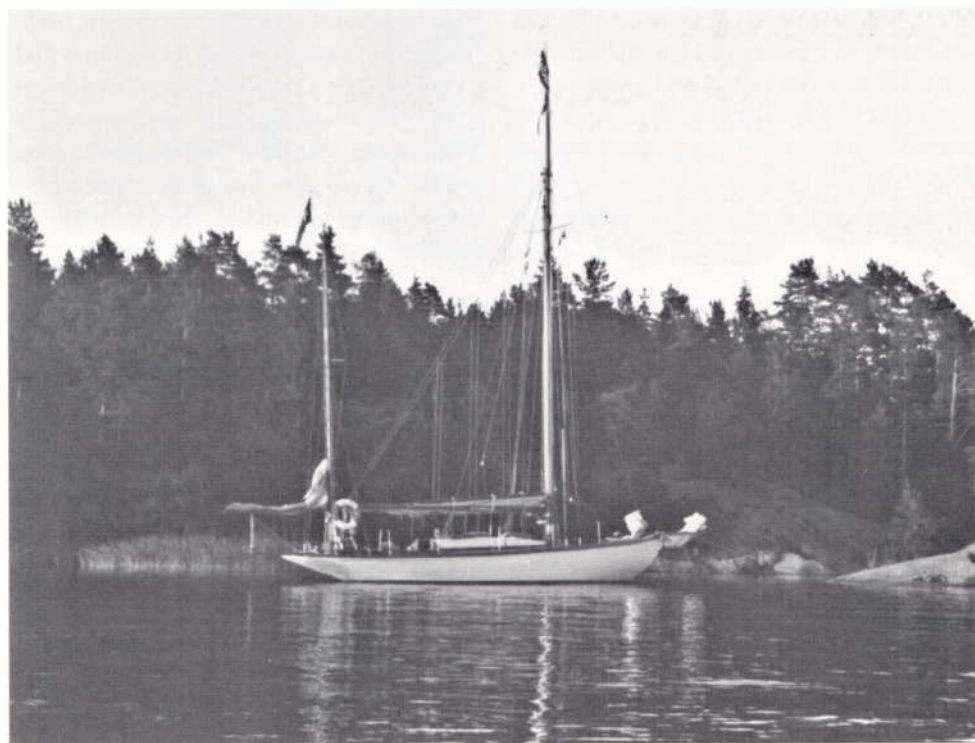
For anker i skærgården

blev et udtryk for nostalgi og tilbageskuen.