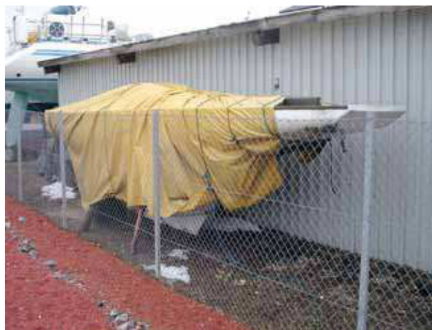
Båden befinder sig i dag i en hal i Nordhavns-området i København, efter nogle år i en ydmyg krog på Jacob Jensens Bådeværft.