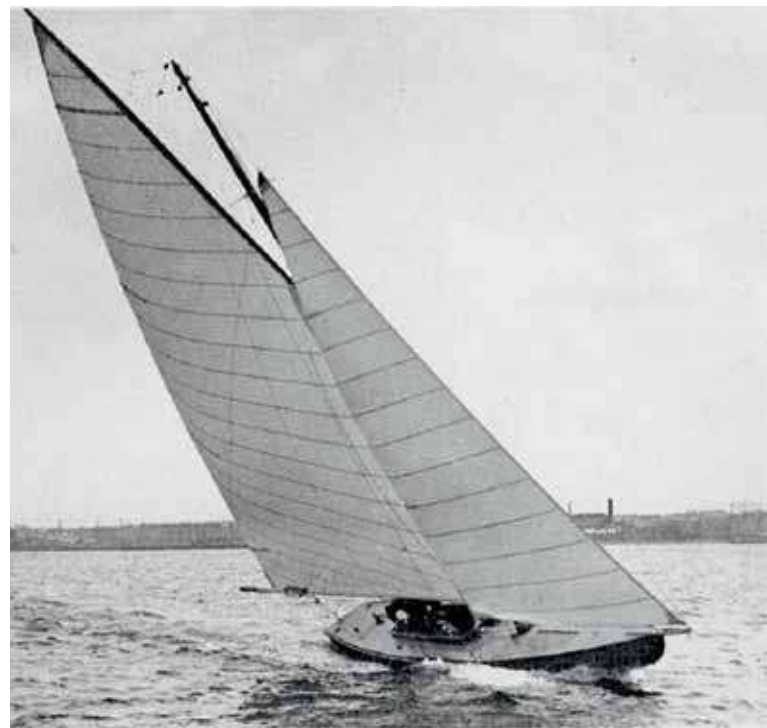
”Tit Tit” på krydset, mens den endnu var gunterrigget