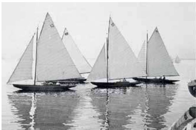
"Tit-Tit" ligger i spidsen i flovt vejr ved en start i Øresundsugen 1912. Efter den kommer "Go on", "Nurdug II" og "Nurdug".

I så fald kan man kontakte ham via mail til: j.thomas.jensen@mail.dk eller mobil: 2621 8508