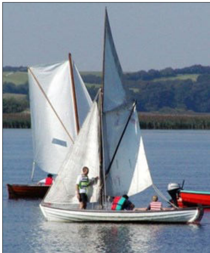
I nogle år sejlede vi sjægte....

dent, så jeg kunne i gamle sejlerblade se, at den tidligere havde vundet mange kapsejladser. Med Occident havde vi en herlig tid med nogle fine ferier i fjorden. Vi var også en tur over Kattegat til skærgården og på Veangern. I 1985 havde vi købt hus i Rønbjerg, økonomien var ikke for god, og vi ville gerne lave noget ved huset. Occident blev solgt i januar 1989. Men hun skulle leveres i Nykøbing på Sjælland. Jeg satte hende i vandet og riggede hende til. Først i februar satte jeg sejl sammen med to kammerater. Vi havde en forrygende sejlads, vinden var vest efterhånden af kulingsstyrke, til sidst sejlede vi kun for fokken med 5-6 knob. Temperaturen var omkring frysepunktet og der var en del snebyger. Vi sejlede hele turen i et stræk