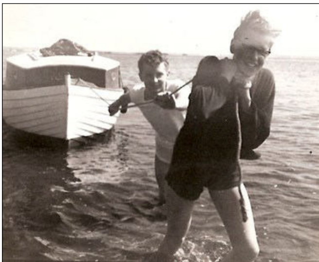
Den lille motorbåd Vito trækkes op ad Ryå.