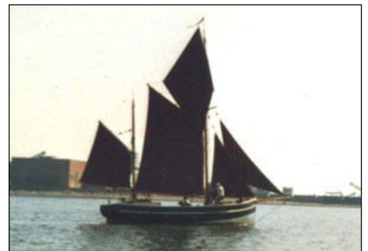
Den færøske fiskesmakke.

I København købte jeg et tomt skrog af en gammel færøsk fiskesmakke. Den var bygget omkring 1920 som sejlførende fiskebåd. havde med tiden fået motor. Efter fisketiden blev den købt af et entreprenørselskab, som byggede havn på Færøerne, de brugte den til arbejdsbåd. Derefter kom den til Danmark hvor ejeren begyndte at føre den tilbage. Han havde dog kun fået motoren pillet ud, dækker og apertingen var væk, så det var et tomt skrog jeg købte. Han havde