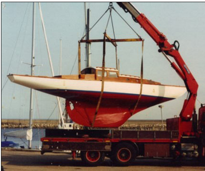
Nordisk Krydser Silvana.

på 25 timer. En værdig afslutning på vores samliv med Occident. Nu hedder hun Gerda af Nykøbing.