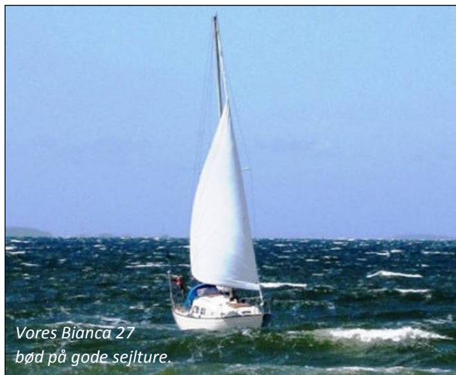
Vores Bianca 27 bød på gode sejlture.

Inden trissen blev solgt havde vi købt Bianca 27. Vi var enige om at i vores alder ville vi have indenbordsmotor, ståhøjde og hygge i kahytten. Det pegede på en Bianca 27, en plastik-