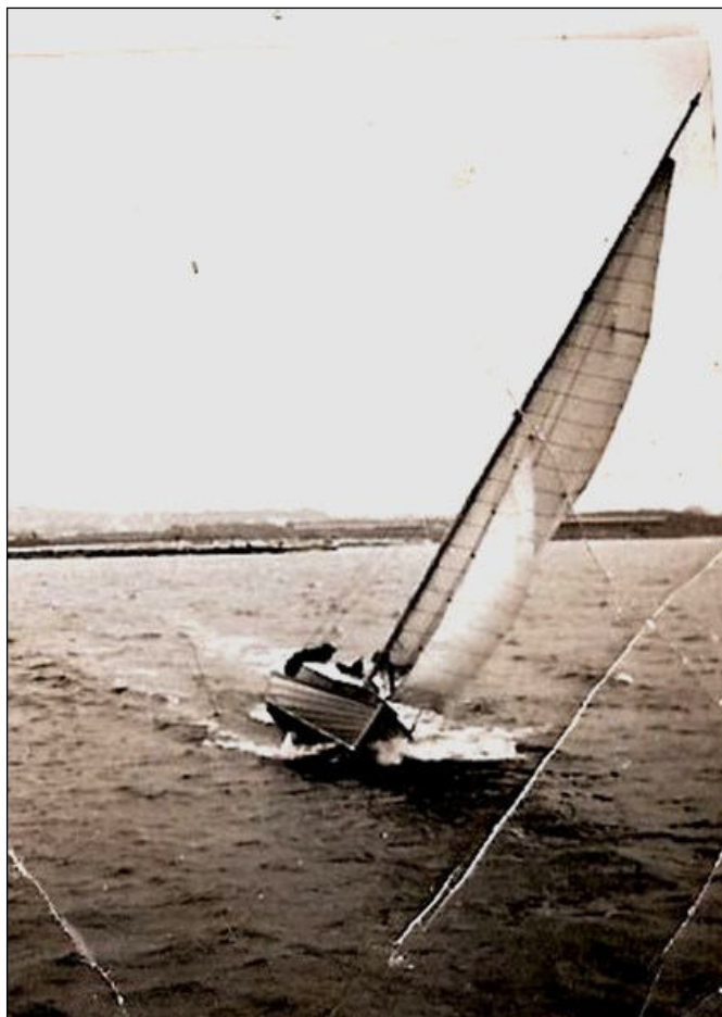
Kragejollen Gry, 18 fod.

M in første båd var en lille motorbåd. Det var en ombygget redningsbåd med en 4 hk Marstal motor. Med Vito, som den hed havde jeg mange gode turer. Tit efter skoletid med kammarater på småture omkring Aalborg. Der blev også sejlet en del weekend turer til Ryå og sommerferie rundt i Limfjorden. Her er Vito på vej op i Ryå, der var ikke ret meget vand lige uden for åen, tit måtte vi i vandet og trække. Vi gik i skole og havde ikke ret mange penge. Til en Weekend tur købte vi 5 liter benzin, så hældte vi 2,5 liter på tanken, så kunne resten bringe os hjem. Senere satte vi en mast på, så kunne vi føre et lille råsejl, det sparede på benzinen når der var medvind. Den helt store tur gik til Mariager