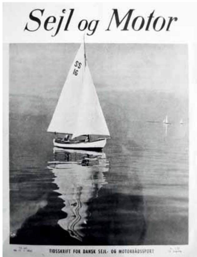
"Nutte" på forsiden af Sejl og Motor 1951 – med sejlmærket SS16 – hjemmehørende i Sundby Sejlforening