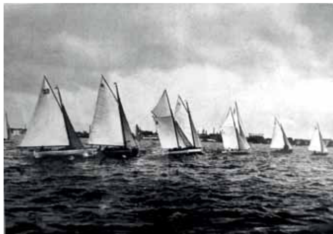
Foto fra Fælleskapsejladsen i Sundet 1930. Hvem ligger forrest i feltet med sejlnummer F 61? Selvfølgelig "Nutte". Båden har så været hjemmehørende i Sejlklubben Frem på dette tidspunkt.

Han kom i mål som den første med et NL-mål på 3,1 – men der var jo masser af både med med både 6 og 7 i NL-mål.