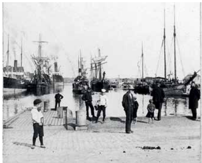
Kolding Inderhavn, hvorfra "No Name" begyndte sit togt