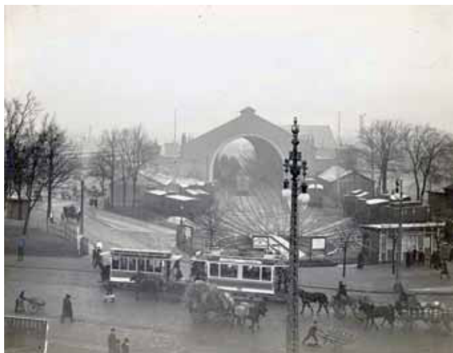
Det var hér fra Københavns anden hovedbanegård, at den store rejse til Kolding begyndte den 4. juli 1903. Den nuværende hovedbanegård blev først indviet i 1911, hvorefter den på billedet blev ombygget til biograf.

Med laber Kuling af Vest stod vi for Klyver, Fok, Storsejl og Mesan sydpaa gennem Fyr Renden. Ak, hvor det løjede, da vi var tvers af Assens var der som Søfolk siger: Bare lidt Aande. Kl. 9½ laa vi udfor Helnæs, der var ikke længer Styreluft, og Vandet havde det polerede Udseende, der keder en Sejlsportsmand. Vi var kun 25 Kvartmil fra Fænø, var vi gaaet derfra en Timestid tidligere, vilde vi nu have været et godt Stykke ad Farvandet, der fører syd om Fyen; og naar jeg saa endda havde benyttet Opholdet ved Fænø til at fylde vor Vanddunk, nu laa vi her og havde ikke fersk Vand. Mygind og Bistrup tilbød da at forsøge at skaffe vand, og skøndt vi laa temmelig langt fra Kysten, gik de gæve