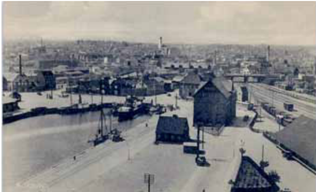
Kolding Havn for ca. 100 år siden

til den Pris o.s.v., nu glæder det mig, at han ikke fik mere, eftersom han ingen Ballast gav mig.