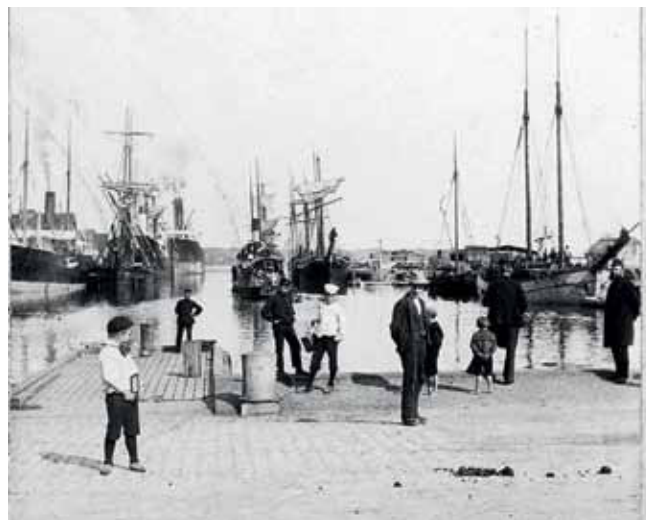
Kolding Inderhavn, hvorfra "No Name" begyndte sit togt