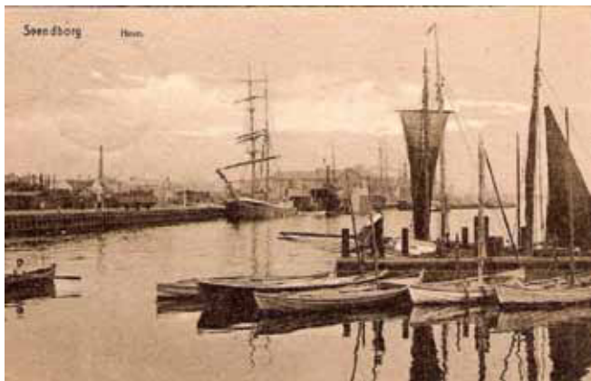
Sådan så Svendborg Havn ud, da "No Name" aflagde visit i 1903