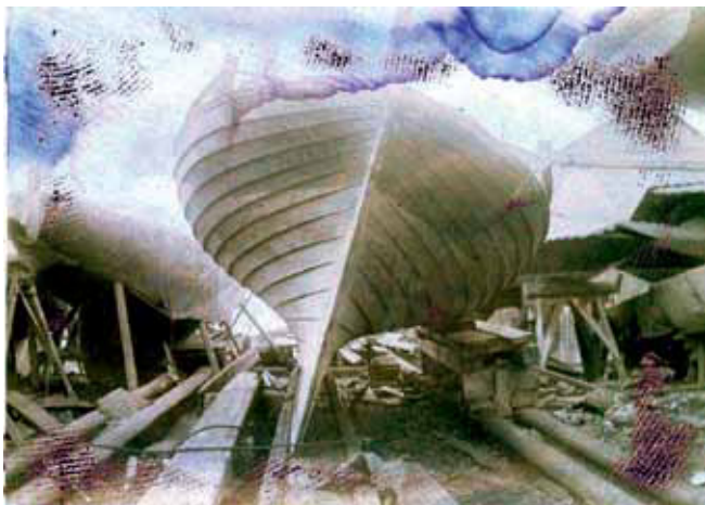
"No Name" i Vinterleje.

Kl. 9½ var vi tvers af Omø og nu gik det rask videre, saa at vi allerede Kl. ca 11 passerede Tokosten paa Kirkegrunden, derefter havde vi Venegrundenes Ballonvager Kl. 12. En halv Time senere sattes Spileren og for dette Sejl samt Storsejl, Topsejl og Mesan løb "No Name" henved 7 Kvartmil i Timen, saa at vi passerede Masnedø, 41 Kvm. fra Lohals Kl. 2½. Det var nu Merssejlskuling af Vest og bestandig plat fortsatte vi østefter forbi Petersværft, gennem Langø Vrid og naaede Kallehave, 52 Kvm. fra Lohals Kl. 4, hvor vi ankrede op og besluttede at