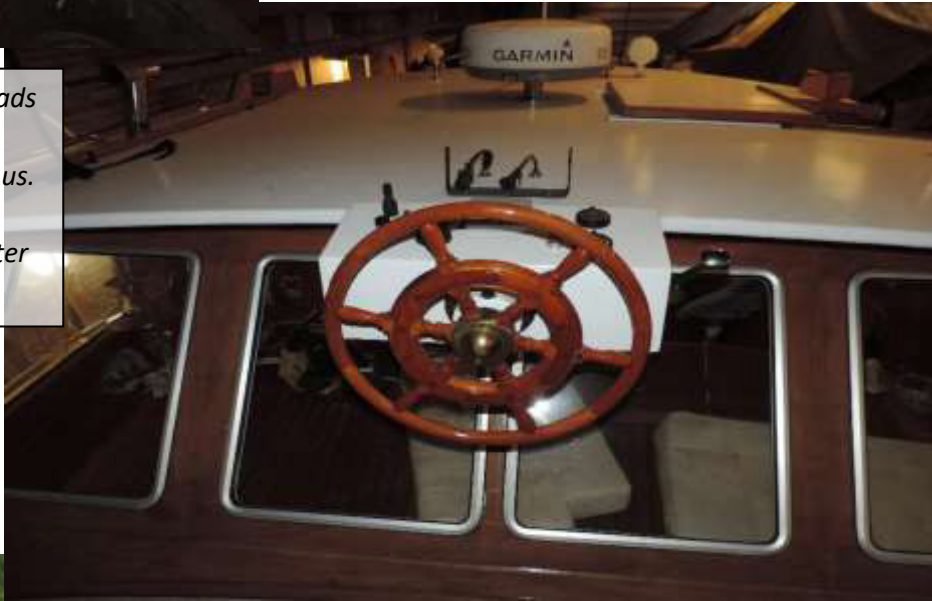
Ninna i en biflod til Kielerkanalen

Styringen er kompletteret med en styreplads på agterdækket hvor der er meget bedre oversigt over båden end i det store styrehus. De mest vitale dele af motoren kan overvåges herfra, ligesom der er kortplotter og radar.