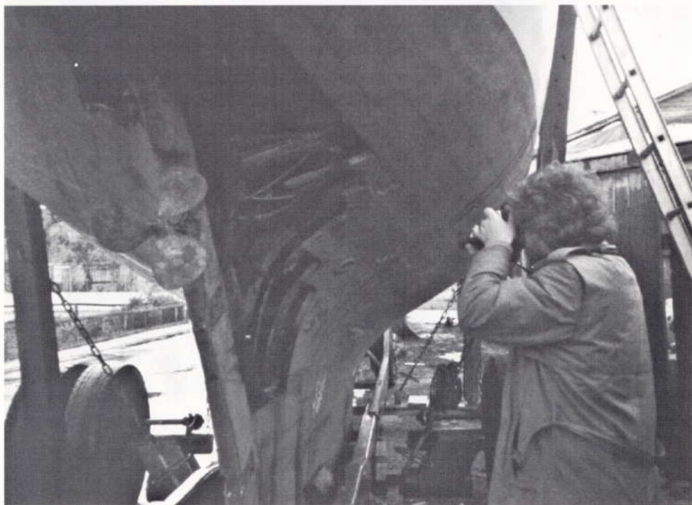
Da jeg brækkede disse planker ud, udbrod en svend som stod i nærheden; "Hvem fa' en er det der tømmer lokummer her" - Det var ikke overdrevet