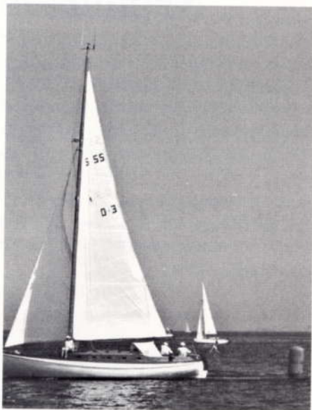
Neptun runder det første sejladsmærke

Neptun er en stor båd, især da for den tid da den blev bygget - lige før de store plasticbåde kom - specielt føles den stor, ifølge