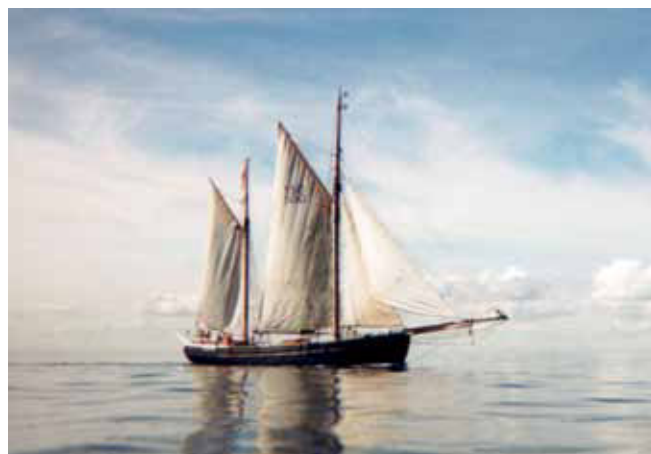
Galeasen "Skibladner" blev Evas tilbagekomst til træbåds miljøet. Båden var ejet af FDF, og Eva sejlede med gennem et par sæsoner, før hun kastede sig ud i bestræbelserne for at få foden under eget ruf