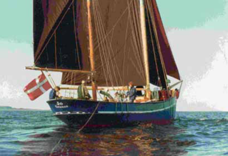
Evas tidlige bekendtskab med fartøjer af træ – nemlig hajkutteren "Jo" – som her ses på Kattegat – med harpunloggen på slæb