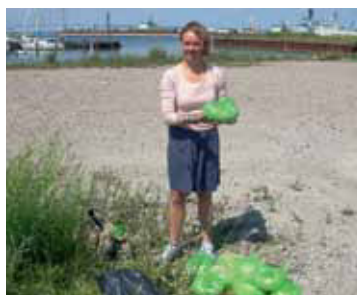
Folkebåden "Amanda" var jo frygteligt utæt, så her i Korsør Havn har holdet provianteret savsmuld hos en lokal tømrermester til at fodre båden med under vandlinjen