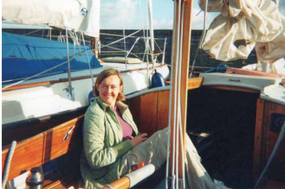
Nyerhvervelsen "Amanda" i Vedbæk Havn

Der hersker altid fest og kreativitet, når fællesskabet er ombord – se blot her et spiseligt bjærgemærs med "Amanda"s navn på