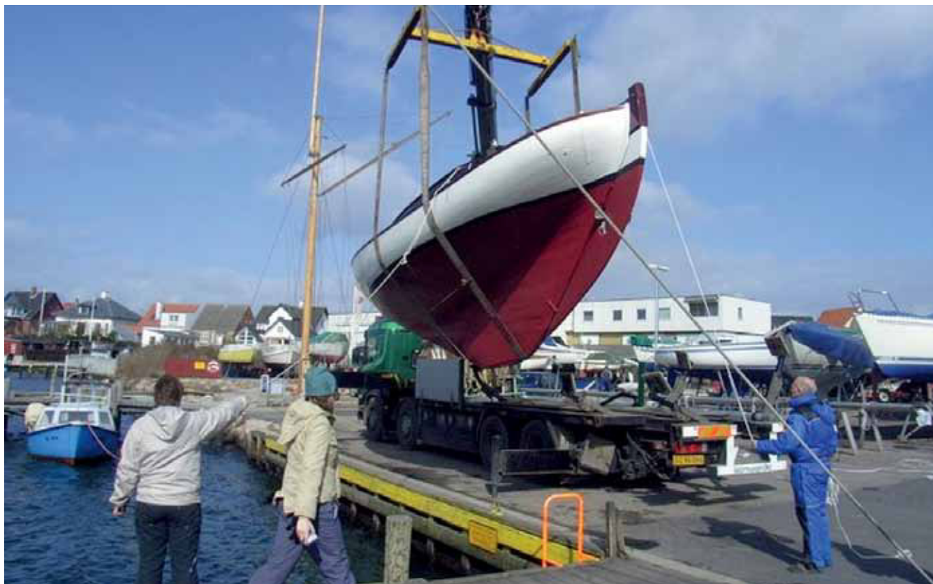
Endelig blev "Passat" søsat i Fåborg Havn i 2008 og kunne derfor deltage i DFÆL-træffet i Assens i starten af juli

Læs Evas fornøjelige beretning om det store bådskippe og de første måneder med "Passat" i DFÆL-bladet nr. 97 – find den på DFÆLs hjemmeside under "Bladet"