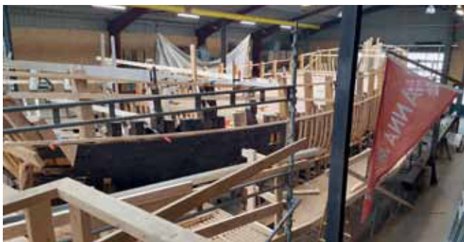
Den omfattende renovering af Anna Møller er i fuld gang, og publikum kan komme ind i hallen for at se på det spektakulære projekt

Foran Tandra står den solide Sommerflid, bygget 1915 i Fredrikssund til en fiskerfamilie i Jægerspris. Lystbåd og nyttefartøj side om side. Nu er de frivillige