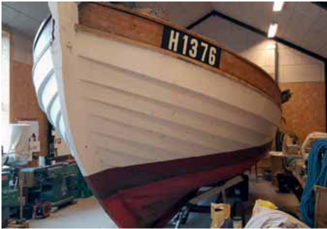
Fiskefartøjet Sommerflid drives i dag som museumsfartøj af et frivilligt laug. Nu har de lejet sig ind på værkstedet til et renoveringsarbejde