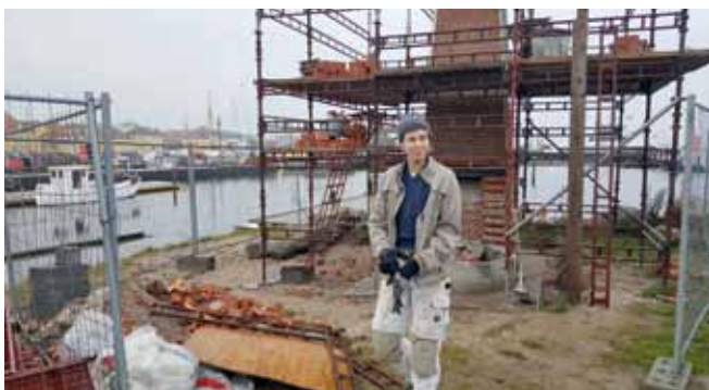
En barkegryde er ved at blive bygget. Her skal der barksesjl på traditionel vis