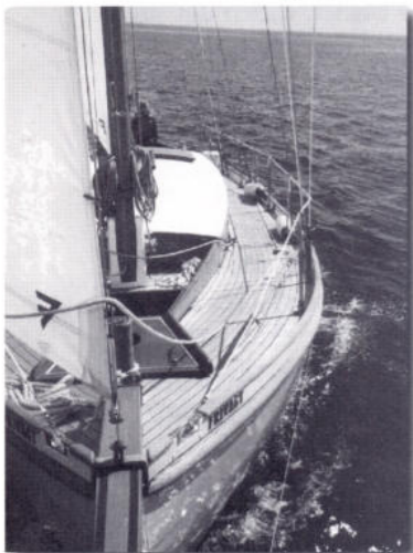
Herover: Frivagt på vej til Bornholm. I midten: Göta Kanalen i 1998 Til højre: Bygning af nyt cockpit foråret 1989.