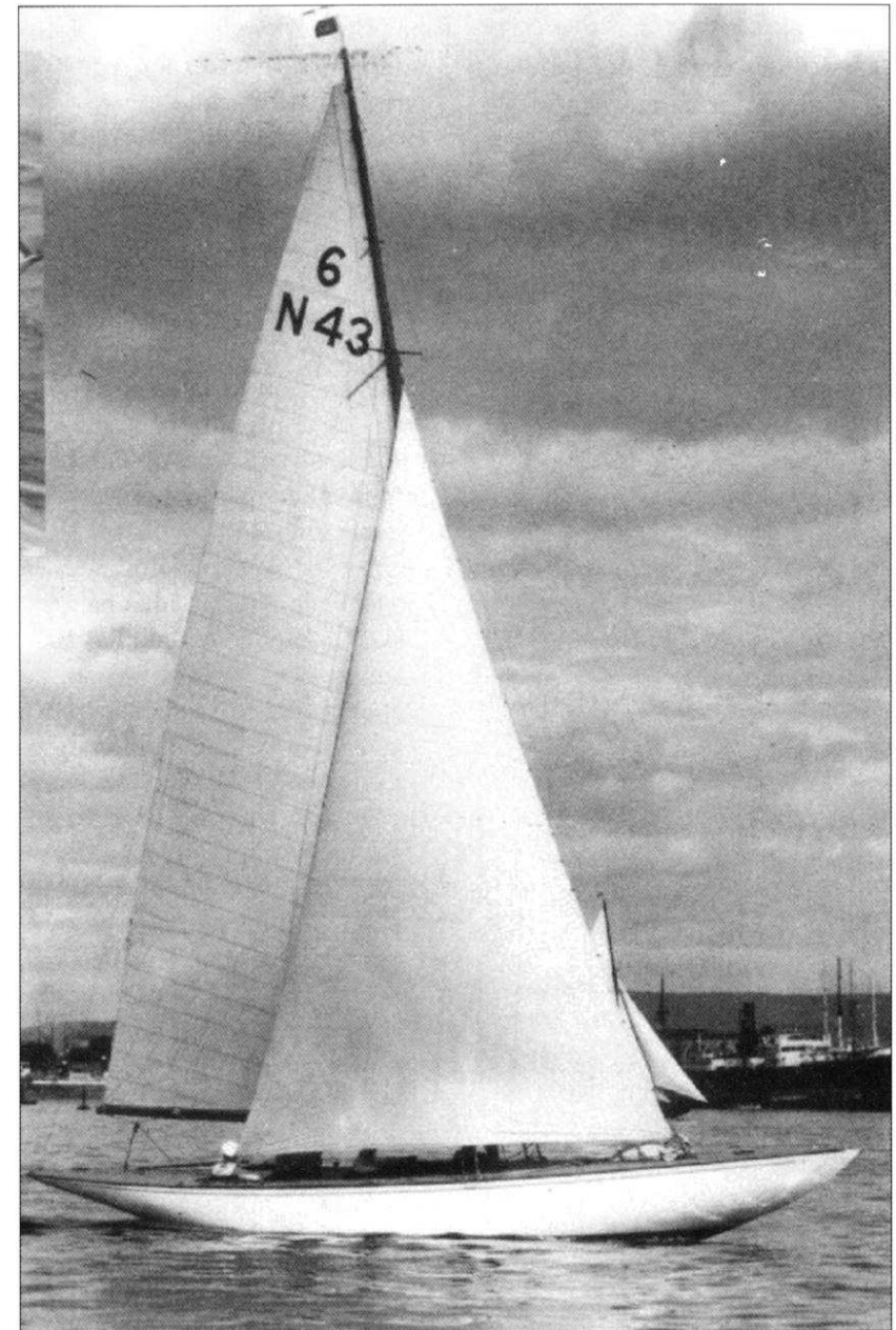
6-meteren Norma V fra 1936 - den norske kronprins Olav vd roret.