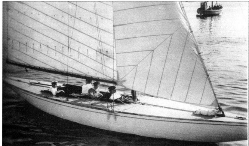
6-meteren Oslo II, bygget i 1926, enkelt og smukt dækslayout!