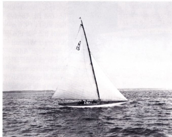
Ambition med den gamle rig

og Jensen A/S i 1918. Da S-reglen blev ændret allerede i 1919, efter krigen, og vedtaget som den nye internationale R-regel er S-bådene i dag et sjældent syn (hvilket vi som ejere selvfølgelig kun synes er med til at gøre Ambition endnu mere speciel).