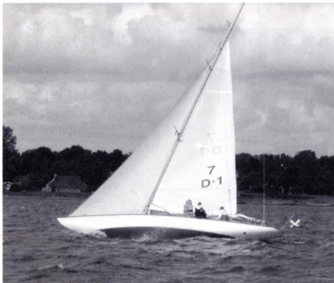
Ambition med den nye rig: kortere bom og større forsejl

ved roret. I 1920 forærede den daværende ejer Ambition til den danske marine, under hvis flag hun sejlede helt frem til 1956.