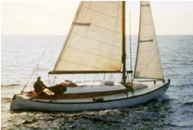
Utzon gav altid prototyperne navne. Den her hedder "Erik"