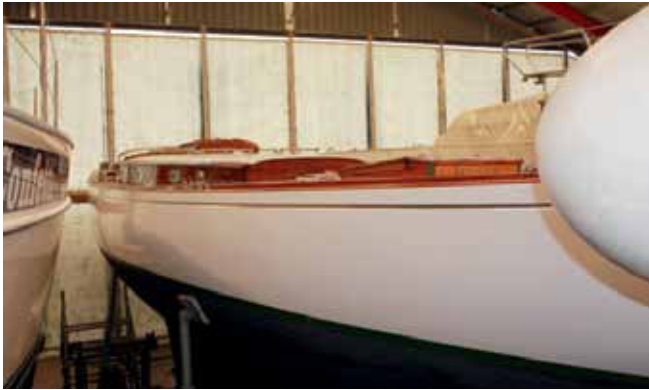
Anitra fra Vedbæk bliver smukt vedligeholdt på Walsted

udført detaljer og kreative løsninger i dækslayoutet. Den er jo en udsøgt lystyacht nu, og det skinner (!) igennem i træsorter materialer i det hele taget og en kompromisløs håndværksmæssig udførelse.