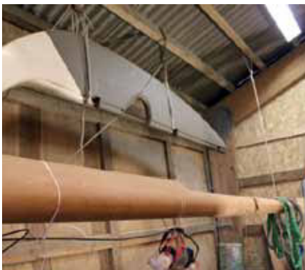
Masten er bygget i 50'erne, men efter originaltegningen