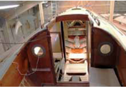
Man fornemmer farten i Utzons design