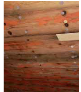
1000 nye propper og endnu flere udsparthinger