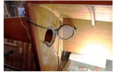
Rufkarmene har ingen glughuller, men skottet har et par store køjer