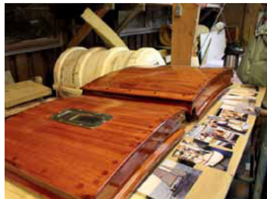
Skydelugerne er i perfekt stand