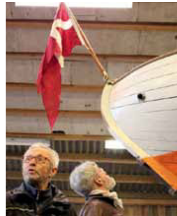
Undine er godt på vej til igen at blive en af de smukkeste og hurtigste spidsgatter. Vi er mange, der glæder os

– Og så har jeg jo fået arbejde igen, siger han glad. Et snedkerfirma har påtaget sig at renovere hele apteringen