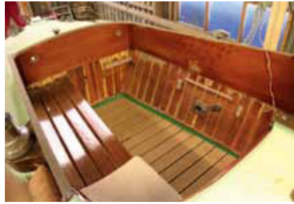
Utzons cockpitlayout med skrå karme under bænkene står originalt