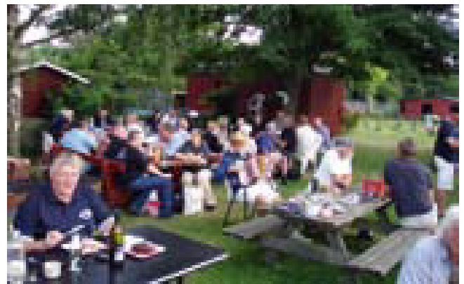
Hygge under de høje træer på havnefronten med grill og udendørs borde og bænke

Det storslåede og fornemme program blev gennemført uden problemer, spændende over en tur til Orlogsmuseet og motorbådsudflugt til Saltholm med rundtur i traktorbus, pirat-søslag i Sundby Havn med børnene som