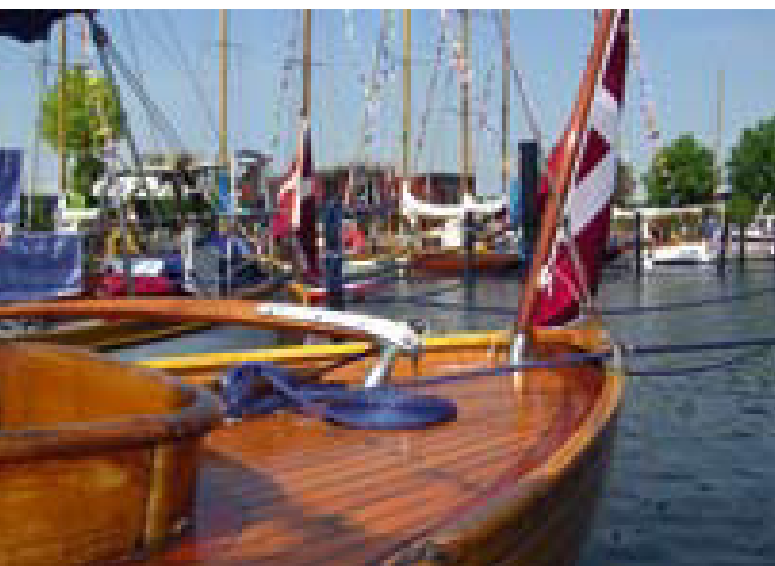
Hen over Ebanas agterdæk ses stævnedeltagere ved vestkajen med festlig flagning