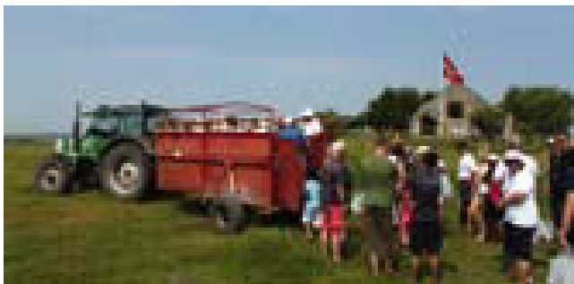
Turen rundt på Saltholm foregik i denne kreaturvogn, så deltagerne blev rystet godt sammen

isolerede og stilfærdige ø-tilværelse på Saltholmen – kun knap 4 sømil fra det Københavnske inferno.