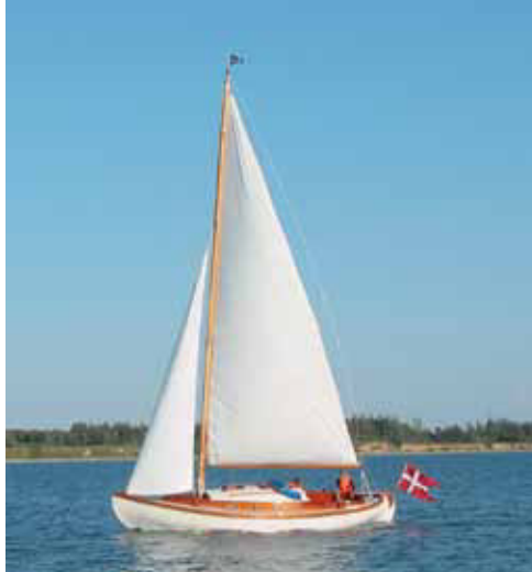
”Anja” på vandet – smuk som en svane.