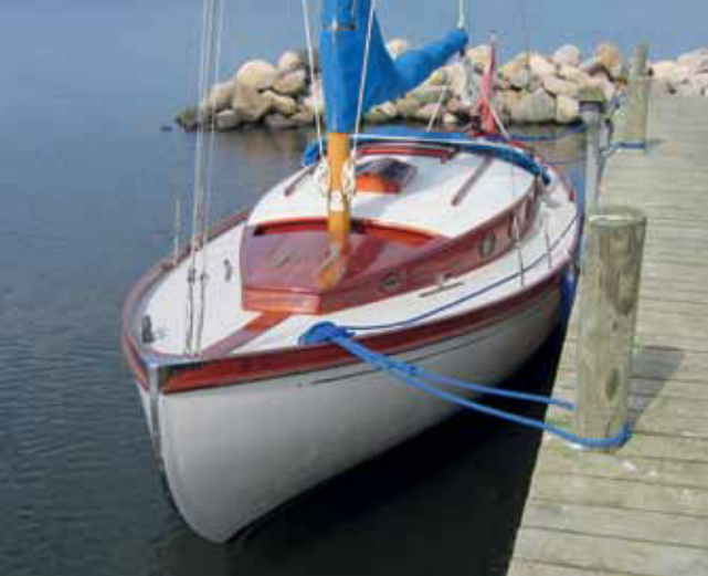
Kan man se noget flottere for sine øjne – ”Anja” ligger og gør sig til ved broen