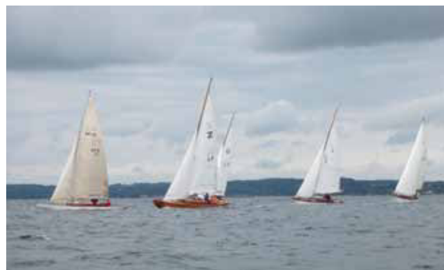
Det blev til hele tre sejladser over 2 dage - 2 korte og en lang – og der blev kæmpet hårdt på banerne