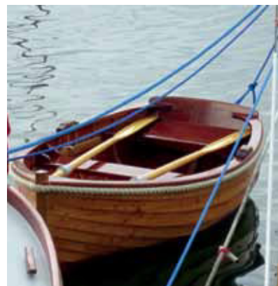
Også skibssungen ”Sorine” stråler som en perle, her tæt op til sin mor ”Anja”